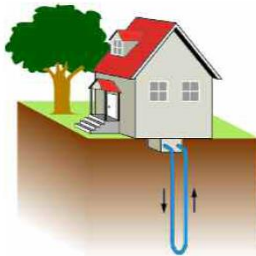
Schema einer Erdwärmesondenanlage

Erdwärmesonden bestehen aus Sondenfuß und endlosen, vertikalen Sondenrohren, z.B. aus hochdichtem Polyethylen (Polyethylen High Density = PE-HD). Der Sondenfuß und seine Anschlüsse an die Sondenrohre sind werkseitig herzustellen. Die fertigestellte Erdwärmesonde ist einer Druckprüfung zu unterziehen, nach Einbau der Erdwärmesonde erfolgt eine weitere Druckprüfung mit Wasser. Die Erdwärmesondenrohre werden jeweils an einen Verteiler angeschlossen und von dort mit der Hausinstallation / Wärmepumpenanlage verbunden. Vor der Inbetriebnahme ist das Gesamtsystem einer abschließenden Druckprobe zu unterziehen.