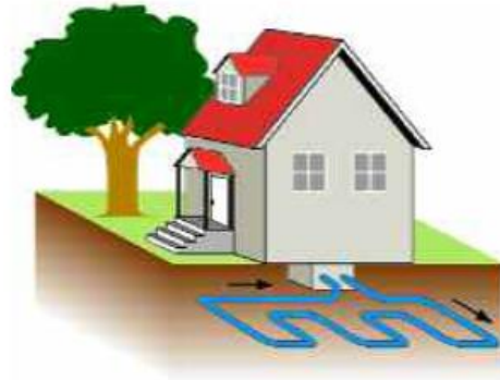
Schema einer Erdwärmekollektorenanlage